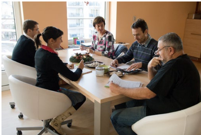
Zasedání správní rady