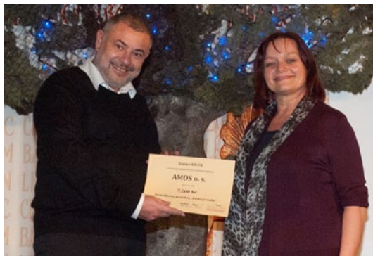
Předání grantu organizaci Amos o. s.