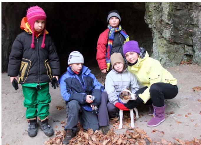
Podpořený projekt: YMCA v Olomouci

Naší vizí je vybudovat stabilní nadaci se silným nadačním jménem a podporovat misijní dílo křesťanských organizací a církví finančně, konzultací, radou nebo realizací vlastních programů.