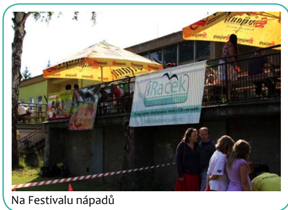
Na Festivalu nápadů

Festival byl určen pro širokou veřejnost a nabízel kromě dobré zábavy i hudby možnost osobních setkání a rozhovorů na téma hledání, víra, Bůh dnes, ... Nadace zde prezentovala svoji práci a mohla navázat hlubší spolupráci.